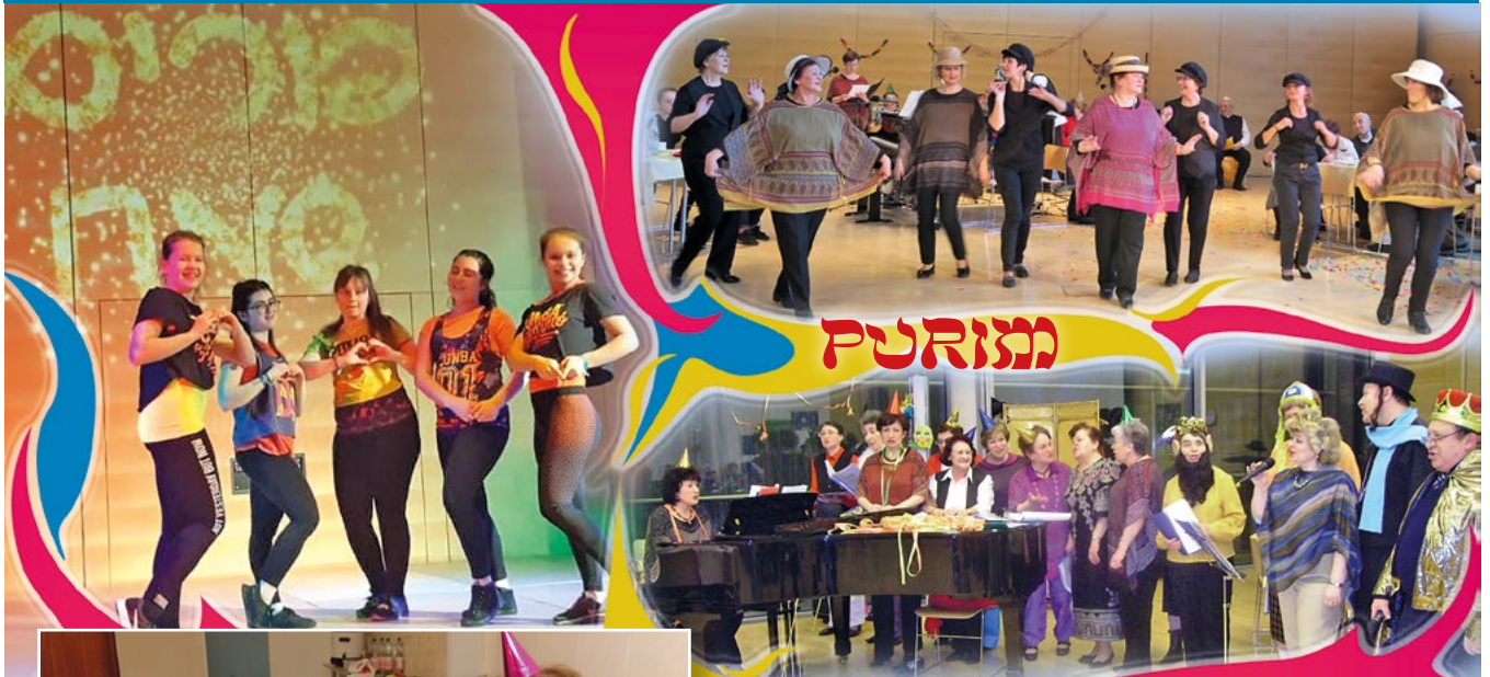
<< Jüdisches Leben