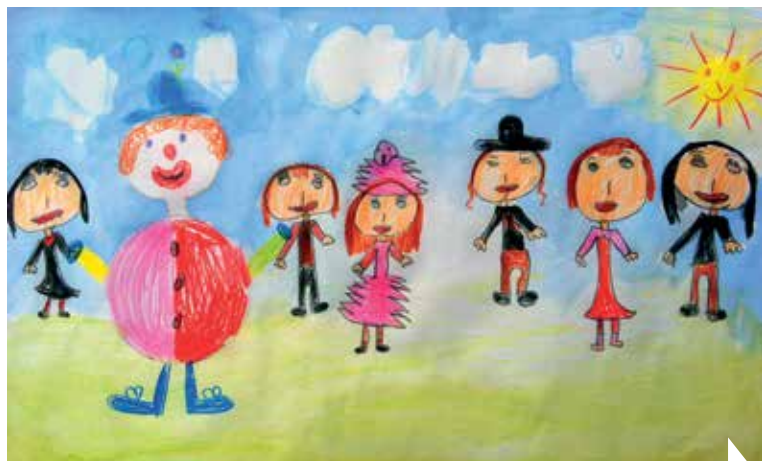
Die Welt mit den Augen der Kinder, S. 2